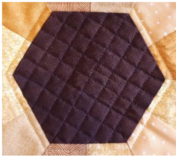
Detalje af quiltning